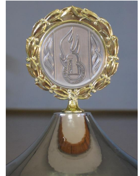
Den Wanderpokal für die Gruppe mit den meisten Teilnehmern erhielt die Jugendfeuerwehr aus Braunfels-Bonbaden.