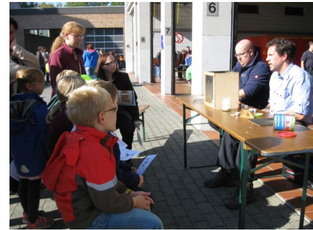
Vorführen einer „Staubexplosion“