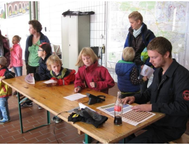
Absetzen eines Notrufes „Schlauchkegeln“