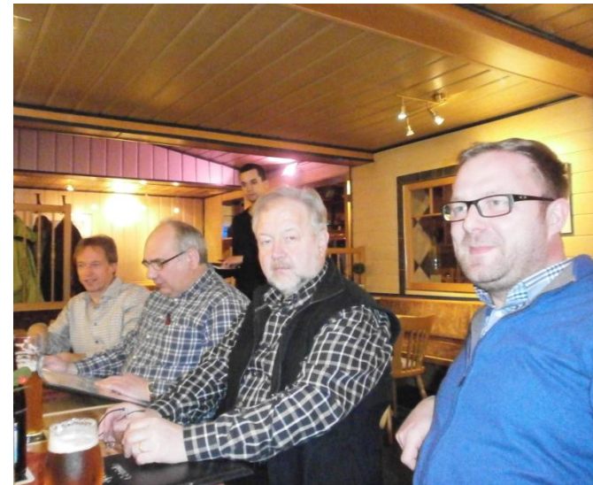
Die Kameradinnen und Kameraden des Musikausschusses bei ihrer Jahresabschlussveranstaltung.