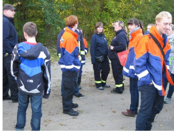
Wandertag der Jugendfeuerwehren des Feuerwehrverbandes Wetzlar e.V. 03.10. 2014 in Hohensolms